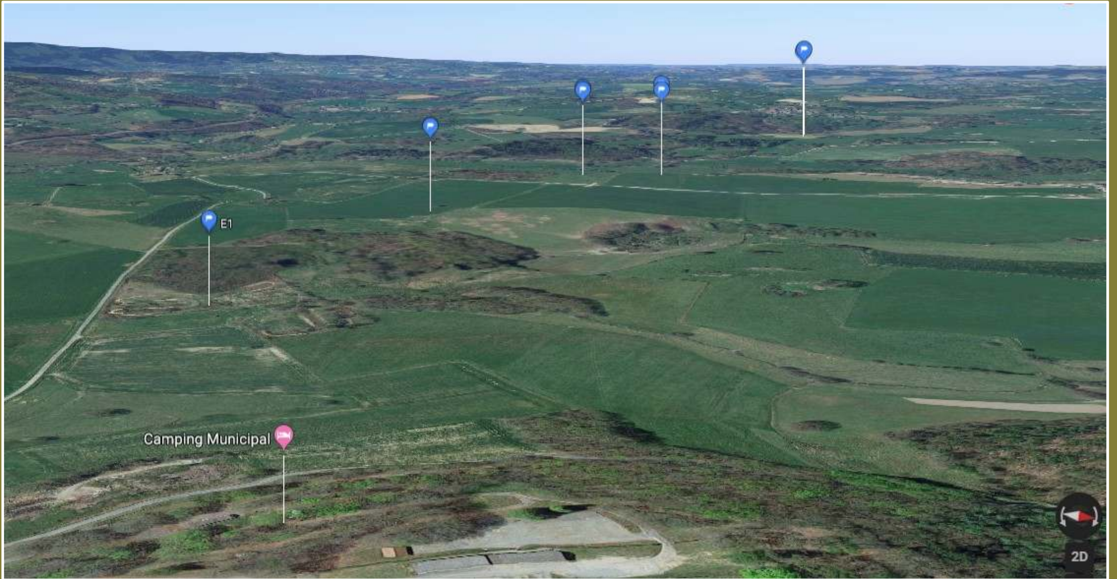
Marsac : Emplacement des éoliennes vu du camping municipal, vue vers l'ouest