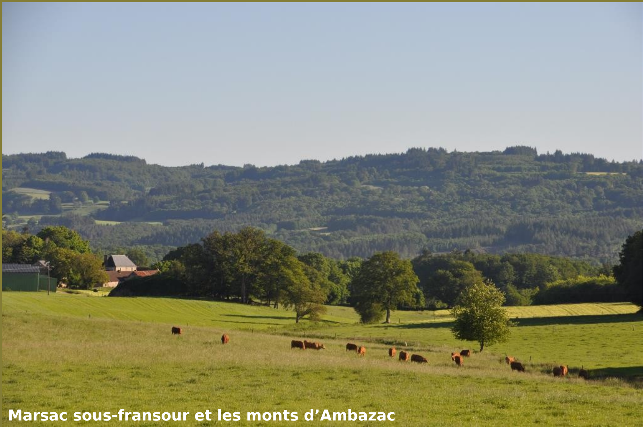
Marsac sous-fransour et les monts d'Ambazac