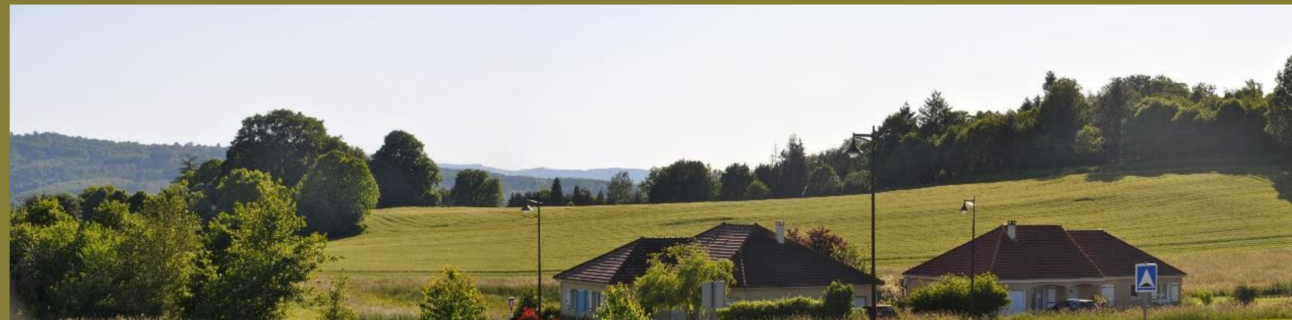
Marsac : vue du cimetière, vue de la résidence des eaux vives