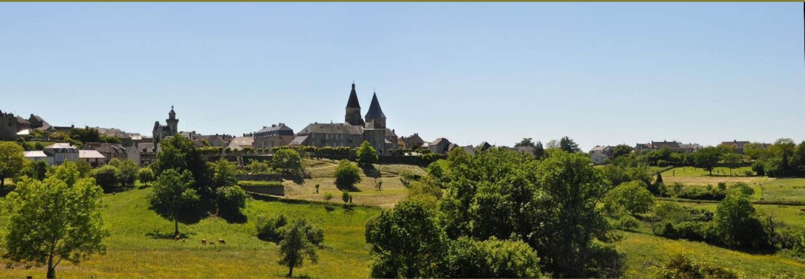
ent-l'Abbaye, sur le chemin de Compostelle