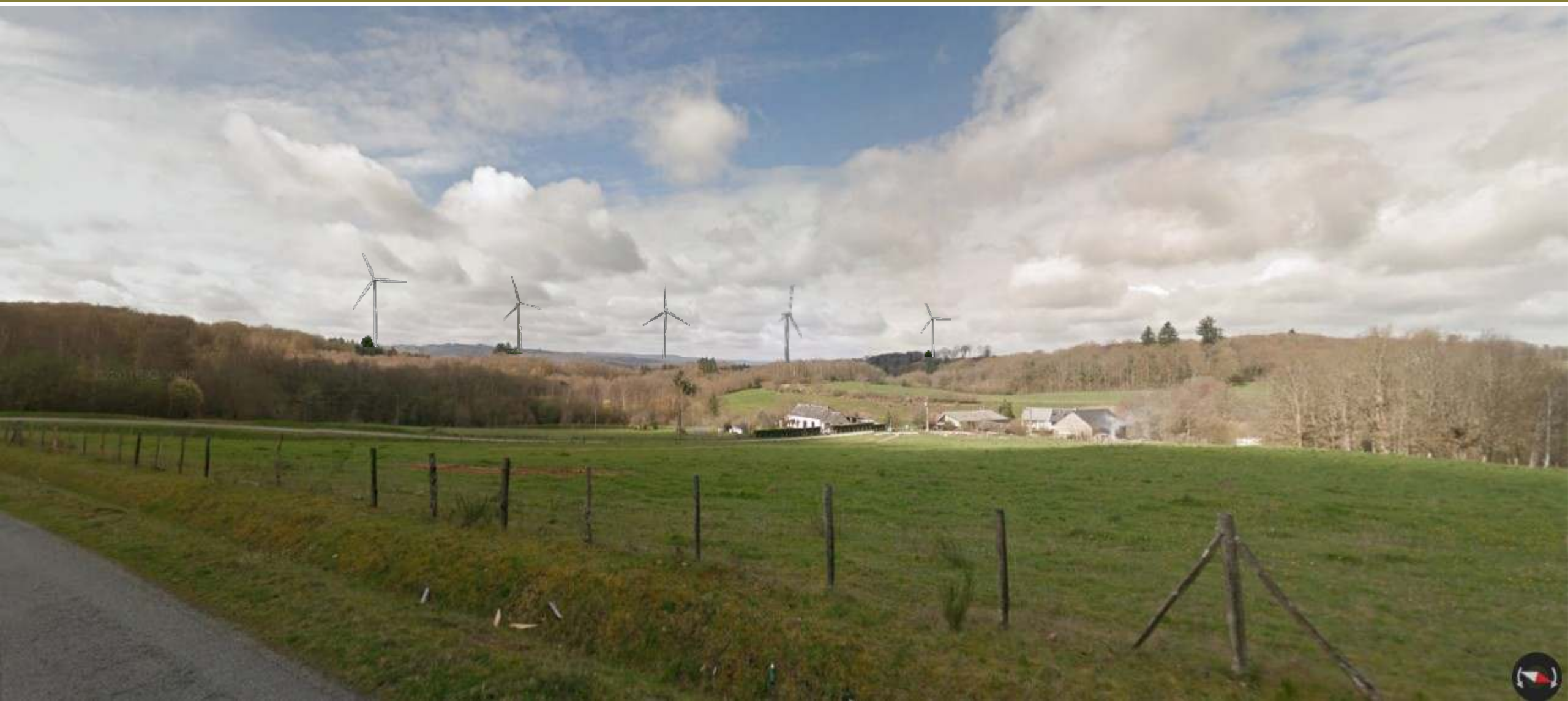
Entre Bénévent l'abbaye et Marsac : la Chaise (à 3 km)