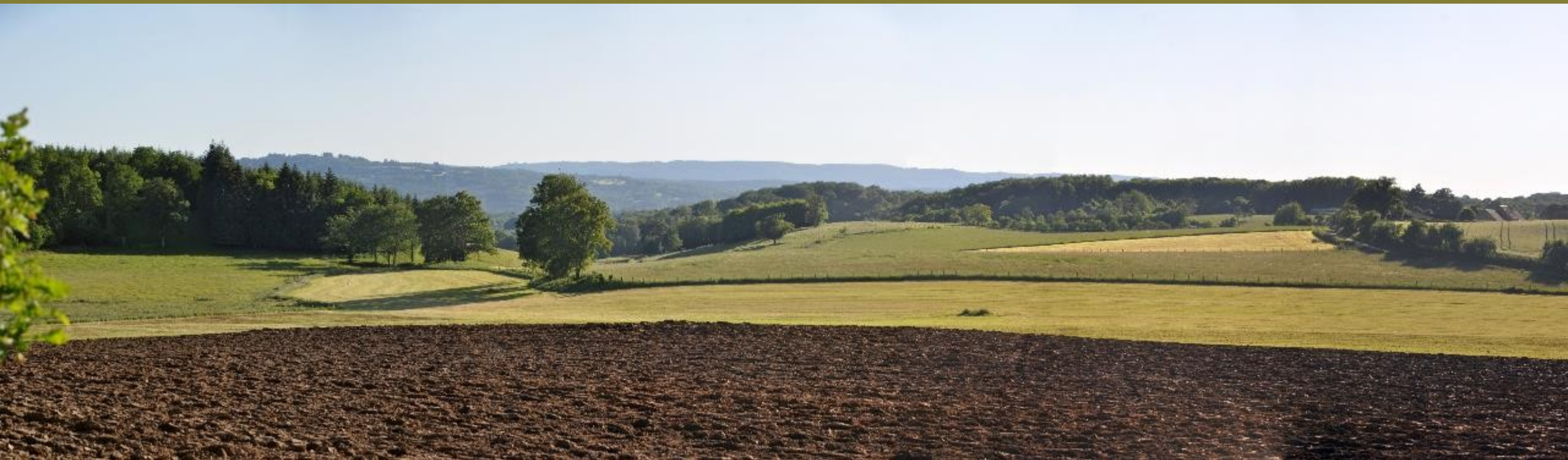
Bénévent-l'Abbaye et Marsac - sous-fransour, près de Jeansannes