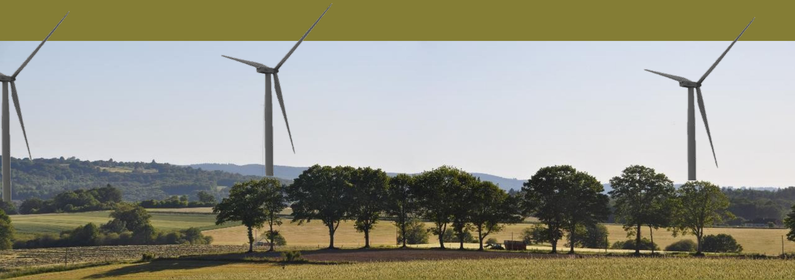
Marsac, Vue vers GAEC Montalaforgeat, de la D42