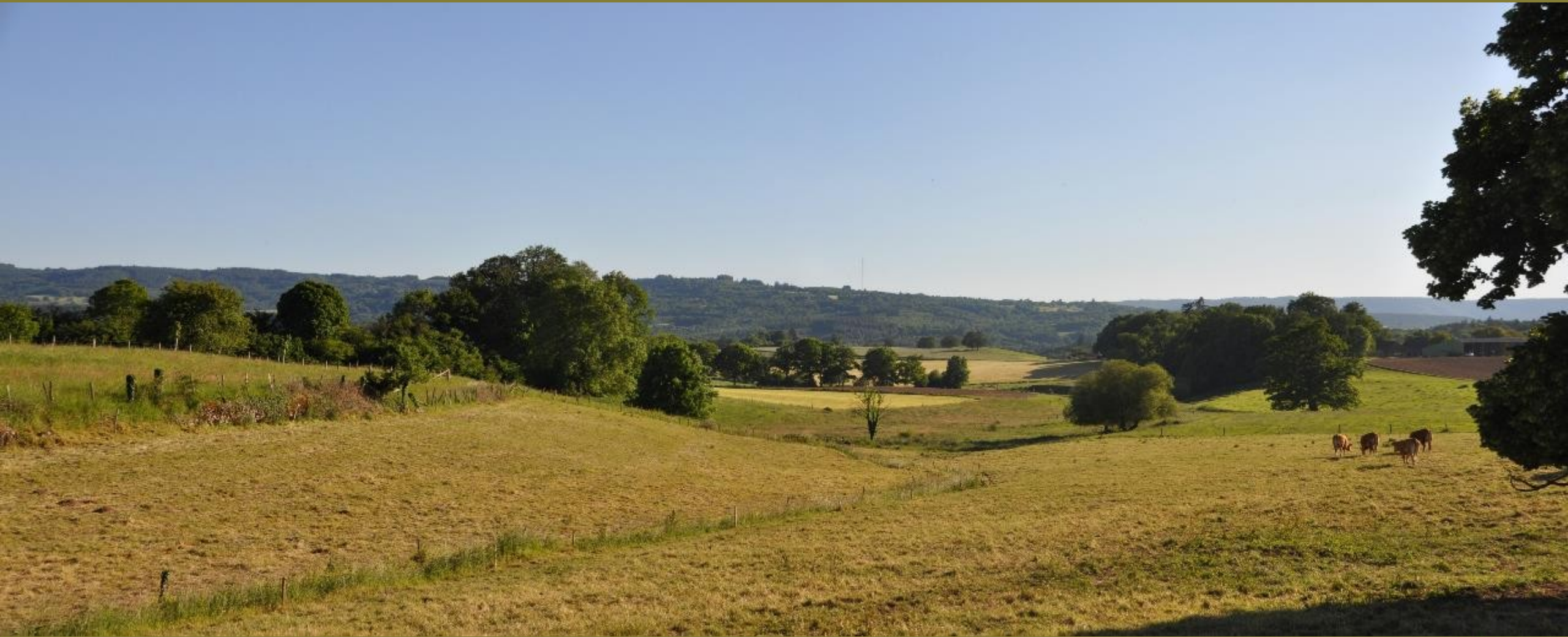
Marsac - Le mont