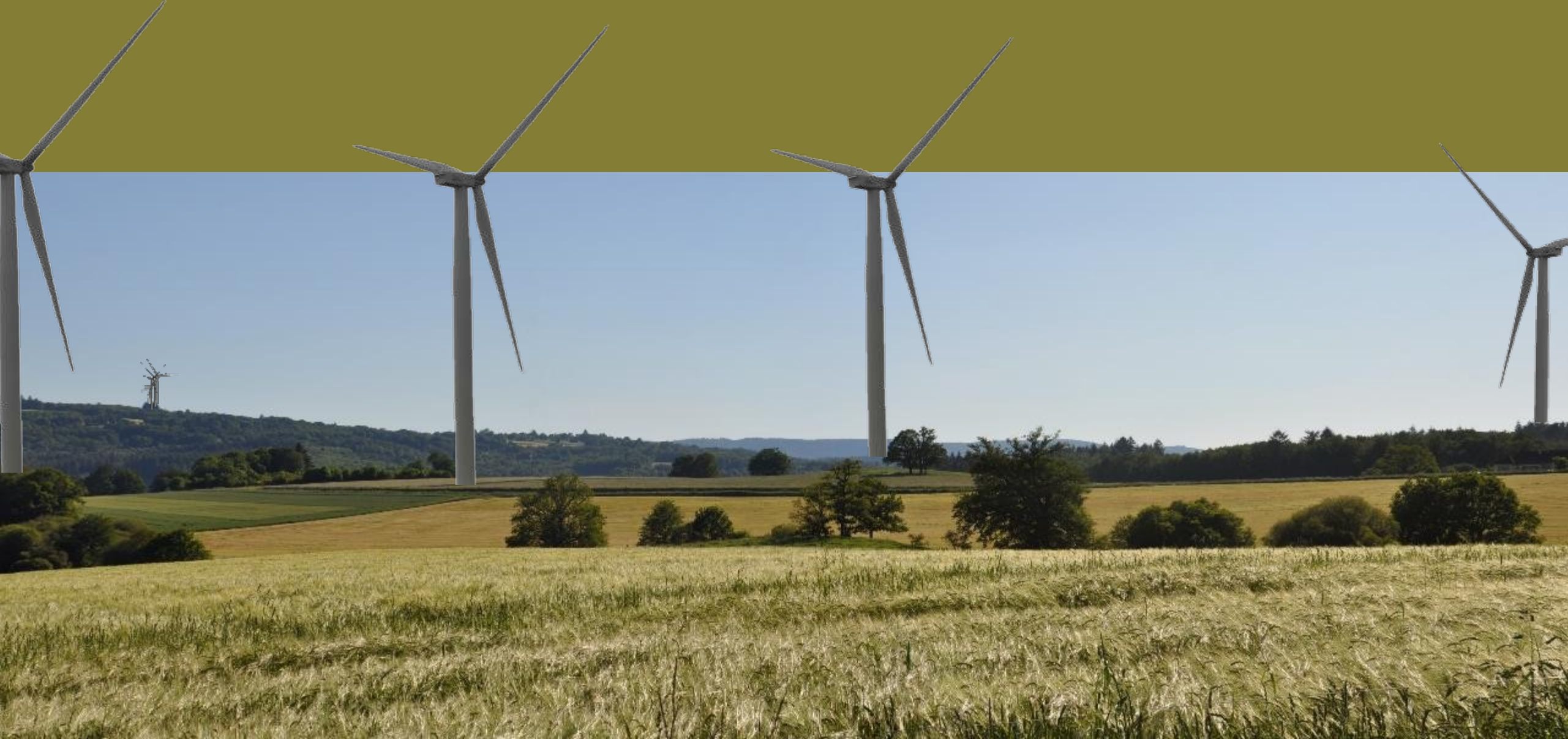
Marsac - Entre l'étang de la Brousse et Le Mont, route D42