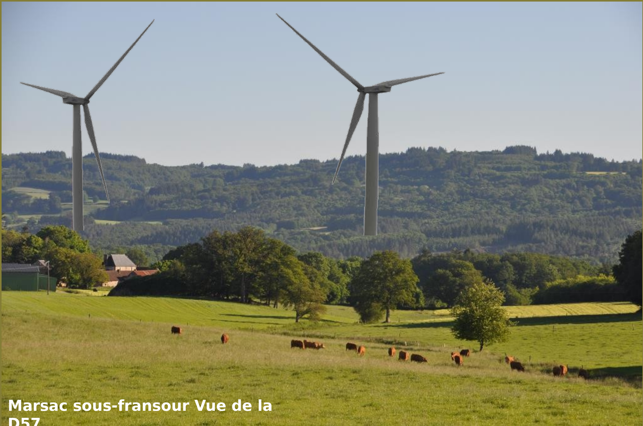
Marsac sous-fransour Vue de la D57