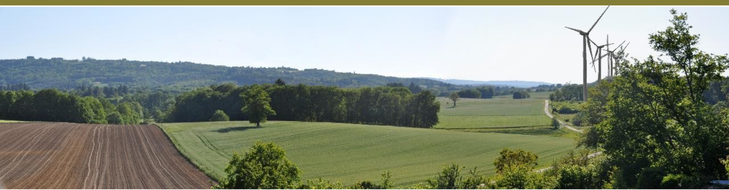
Entrée de Marsac, côté OUEST