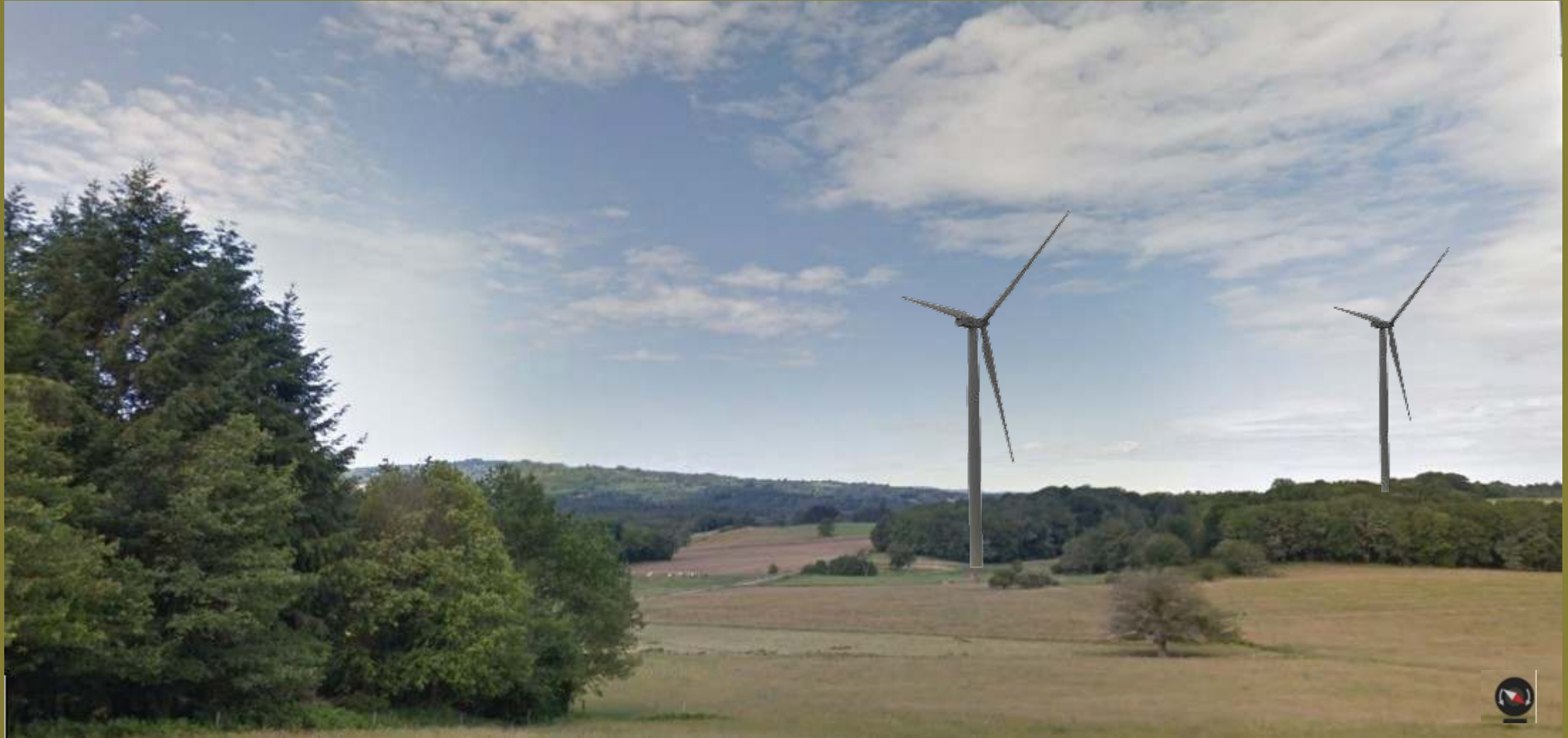
Le paysage des campeurs de Marsac : format réaliste (600m)