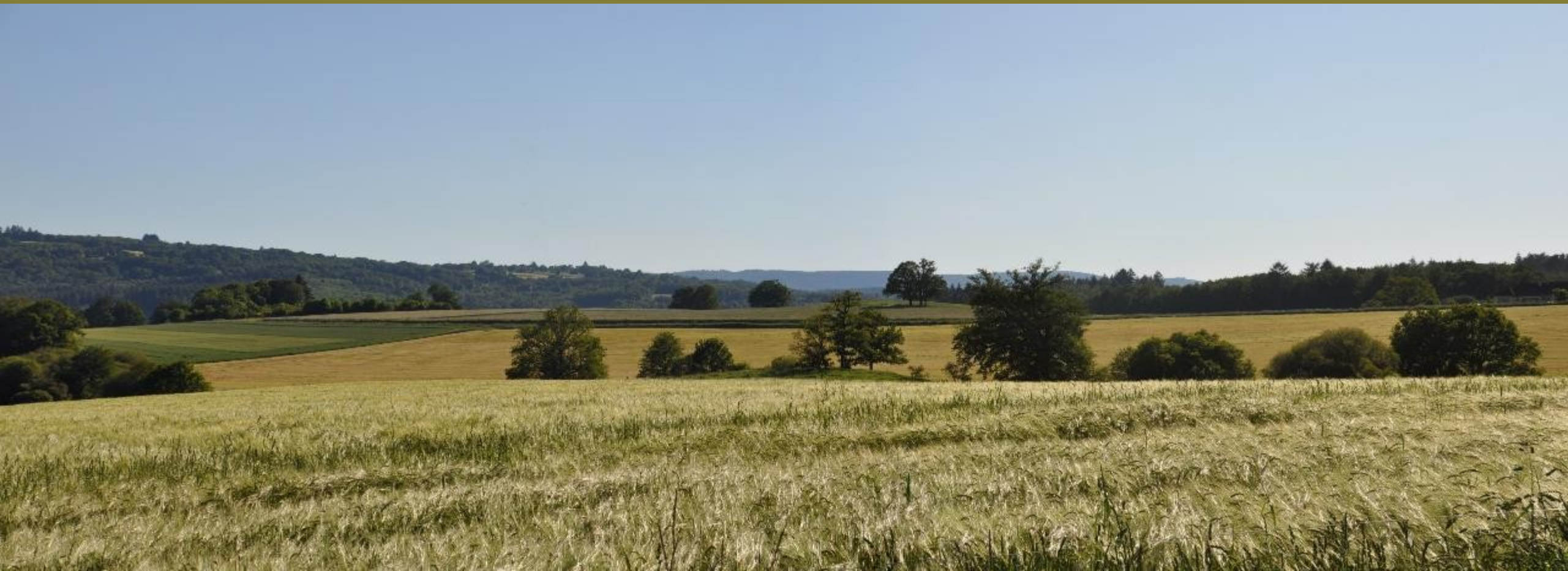
Marsac : Entre l'étang de la Brousse et Le Mont, route D42