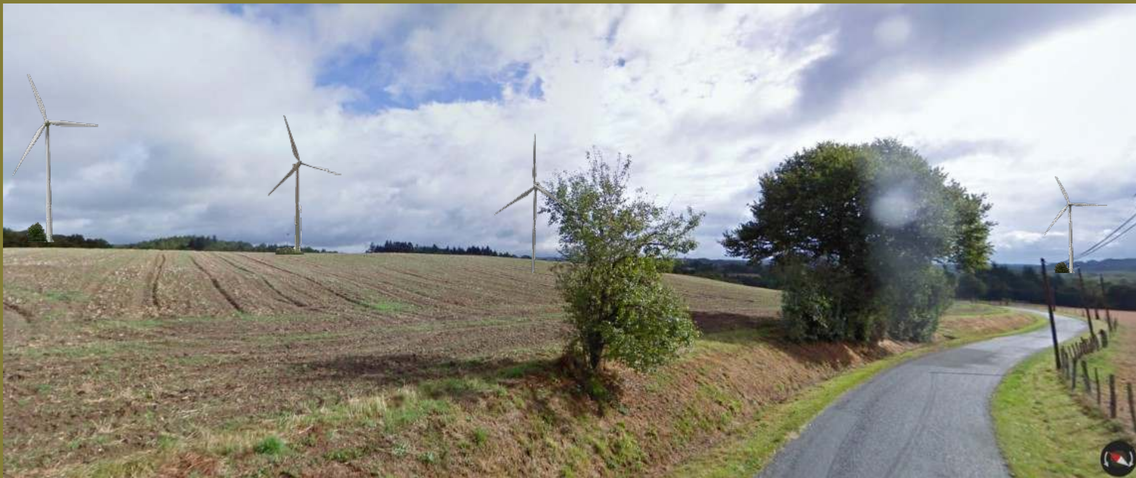
Éoliennes de Marsac vues de: Le Jourdaneix (axe SE-NE) (1 km à 2 km)