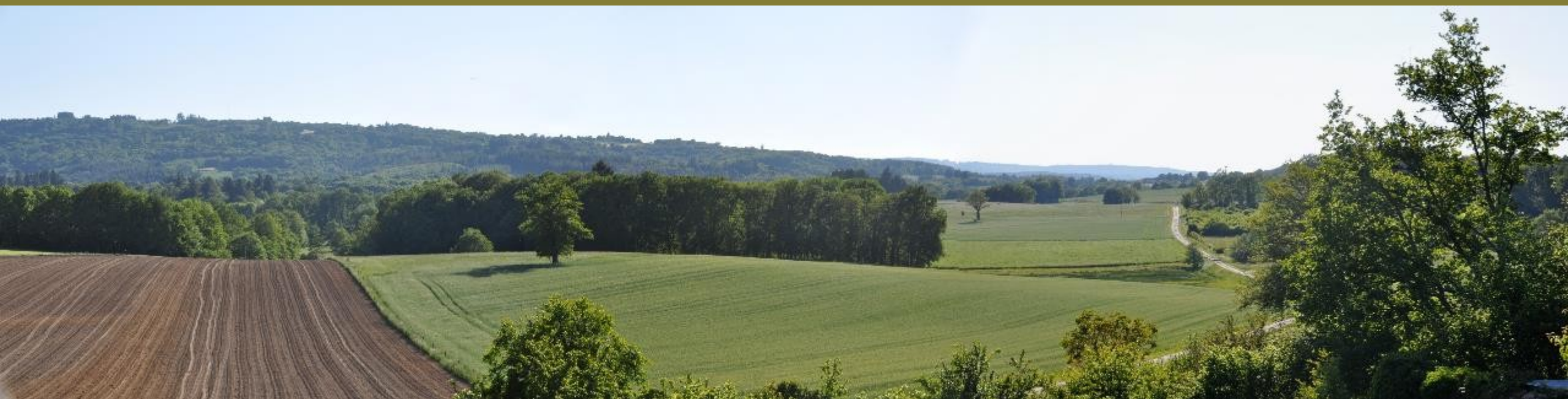
Entrée de Marsac, côté OUEST