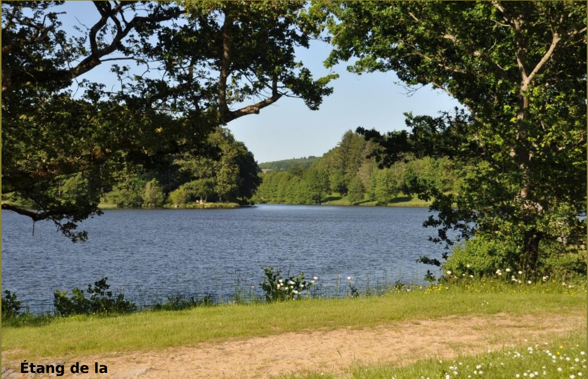
Étang de la Brousse