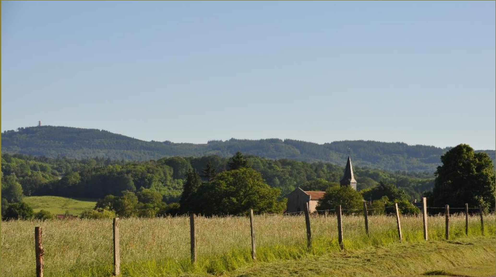
Marsac : Entrée de Marsac par la route D914