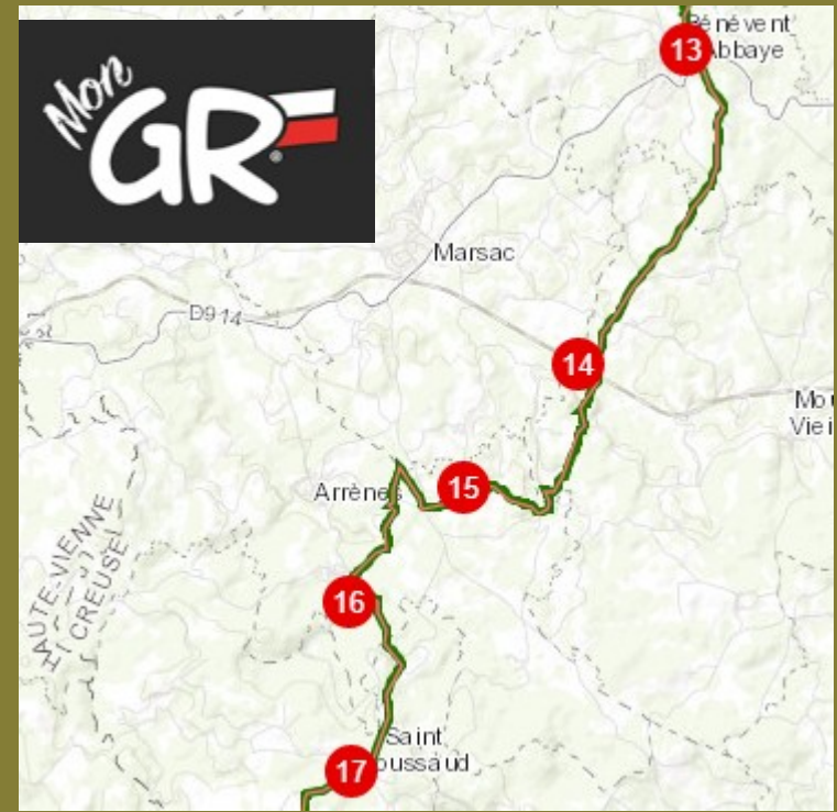
GR® 654, Entre Creuse et Haute-Vienne