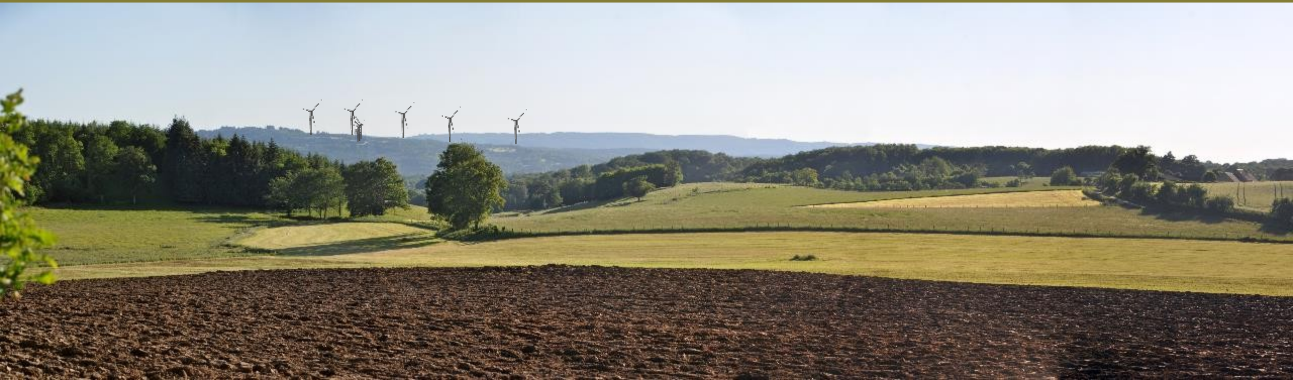
Marsac /sous-fransour et Bénévent-l'Abbaye, près de Jeansannes