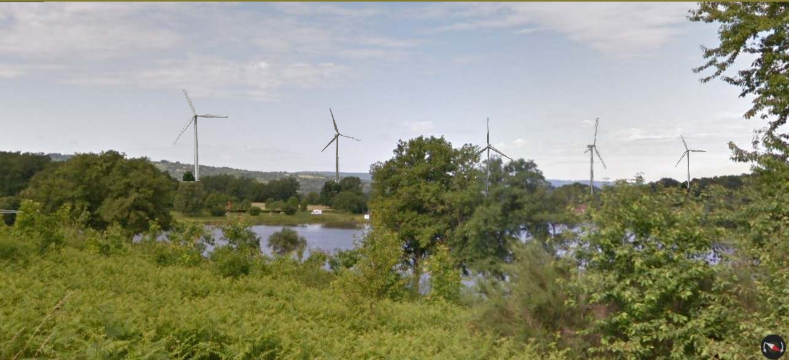
Marsac, Étang de la Brousse