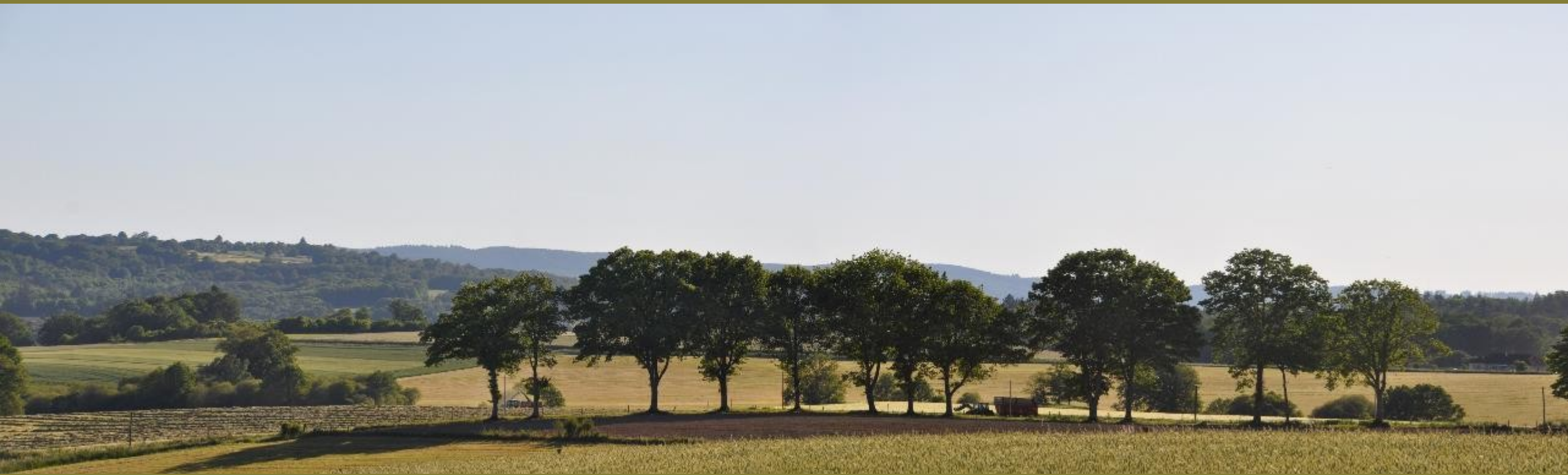
Marsac : Entre l'étang de la Brousse et Le Mont, route D42